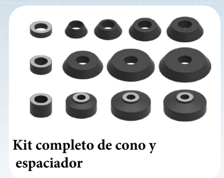
Kit completo de cono y espaciador