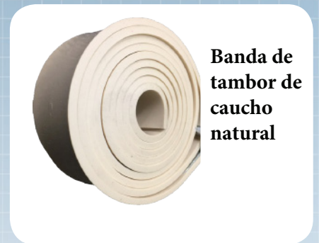
Banda de tambor de caucho natural