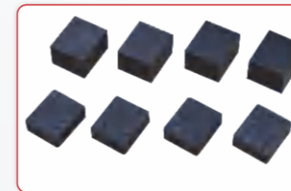
Almohadillas de goma de 1 1/2" y 3" de altura.