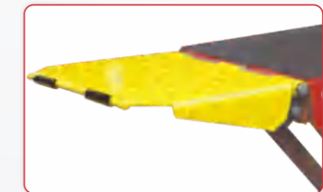
Extiende la plataforma hasta 66".